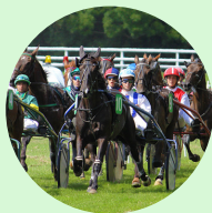
L'hippodrome de Sainte Verge

Venez vous balader sur 5.3 kilomètres à travers les bois et les vignes de Sainte-Verge. Ce parcours convient parfaitement pour les amoureux de la nature et amateurs d'oiseaux qui croiseront votre chemin.